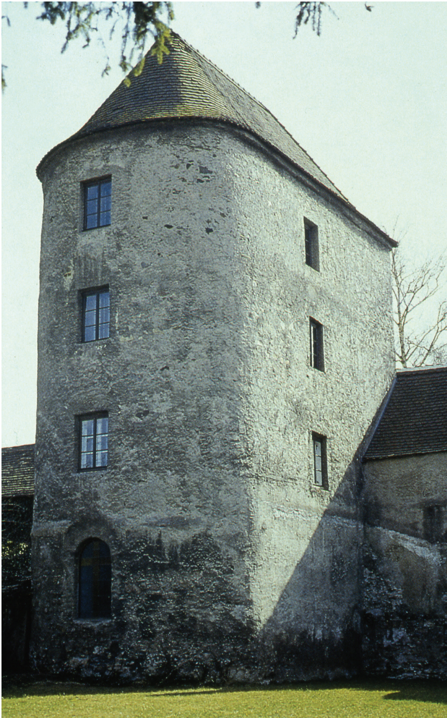
2. Intermediate tower at the north front at the late Roman fort of Traismauer Zwischenturm an der Nordflanke des spätantiken Kastells Traismauer