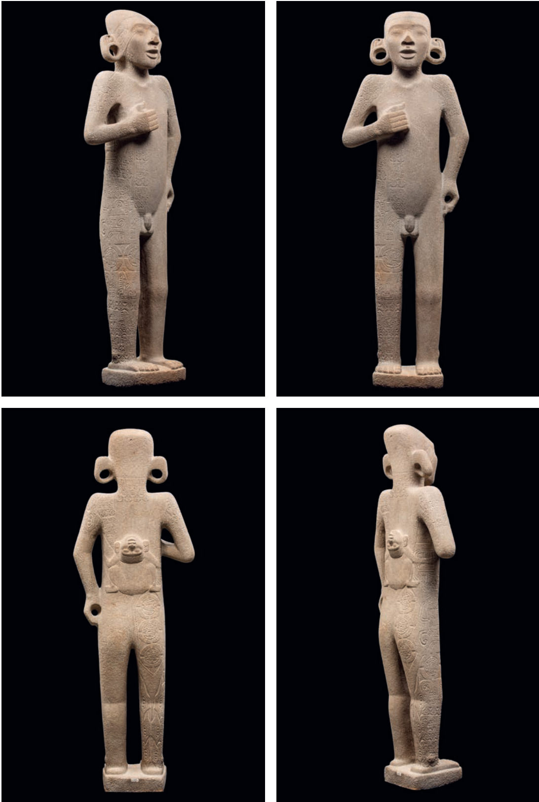
Figura 2. El 'Adolescente Huasteco o de Tamuín', MNA, Ciudad de México, estado actual (junio 2024).