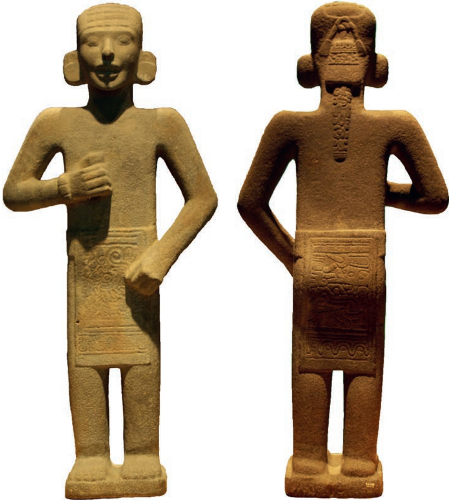
Figura 1. El ‘Adolescente de Jalpan’, vista frontal y vista posterior. Sala del Golfo, MNA.

Inexplicablemente, la escultura hasta ahora no ha sido objeto de un estudio riguroso, a pesar de que me parece una obra de indudable valor simbólico y estético. Parecería que la figura del ‘Adolescente