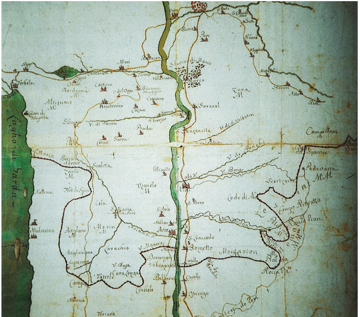
Figura 1.10. Mappa del XVII secolo riportata da Gorfer 1993 (da Brogiolo, Azzolini 2013).