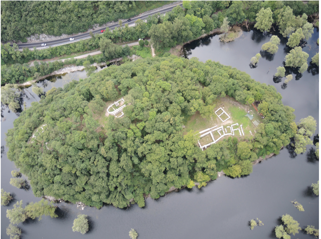
Figura 1.5. Foto da drone dell'isola di Sant'Andrea, da est.

quella di Gardumo? Nei pressi arrivavano inoltre anche quelle di Nago e di Brentonico), la relazione con i centri abitati limitrofi e con le famiglie signorili della zona, in primo luogo quella dei Castelbarco. Perfino l'epoca esatta del suo abbandono e della sua conseguente rovina (o del suo smantellamento) ci resta ignota e il dato appare ancora più sconcertante in quanto nemmeno le risultanze archeologiche forniscono elementi sufficienti e conclusivi per quanto riguarda gli estremi cronologici del periodo d'uso dell'edificio 6 .