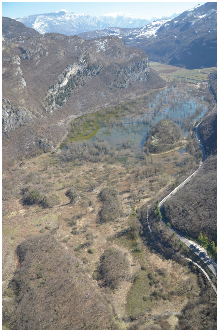
Figura 1.4. Foto panoramica da elicottero dell'alveo del lago di Loppio e dell'isola di Sant'Andrea, da nord.

e di un insediamento castrense, nel 2011 la allora Soprintendenza per i Beni Librari Archivistici e Archeologici della Provincia Autonoma di Trento ha finanziato e coordinato un progetto di consolidamento e restauro architettonico delle strutture archeologiche, cui nel 2012 ha fatto seguito un intervento di ripristino, riqualificazione ambientale e messa in sicurezza del sito, realizzato dal Servizio Conservazione della Natura e Valorizzazione ambientale della Provincia. L'area archeologica è stata quindi provvista di un'installazione pannellistica e affidata in gestione alla Fondazione Museo Civico di Rovereto; dopo l'inaugurazione ufficiale, avvenuta nel luglio del 2013, è stata riaperta al pubblico ed è ora liberamente accessibile da parte dei visitatori.