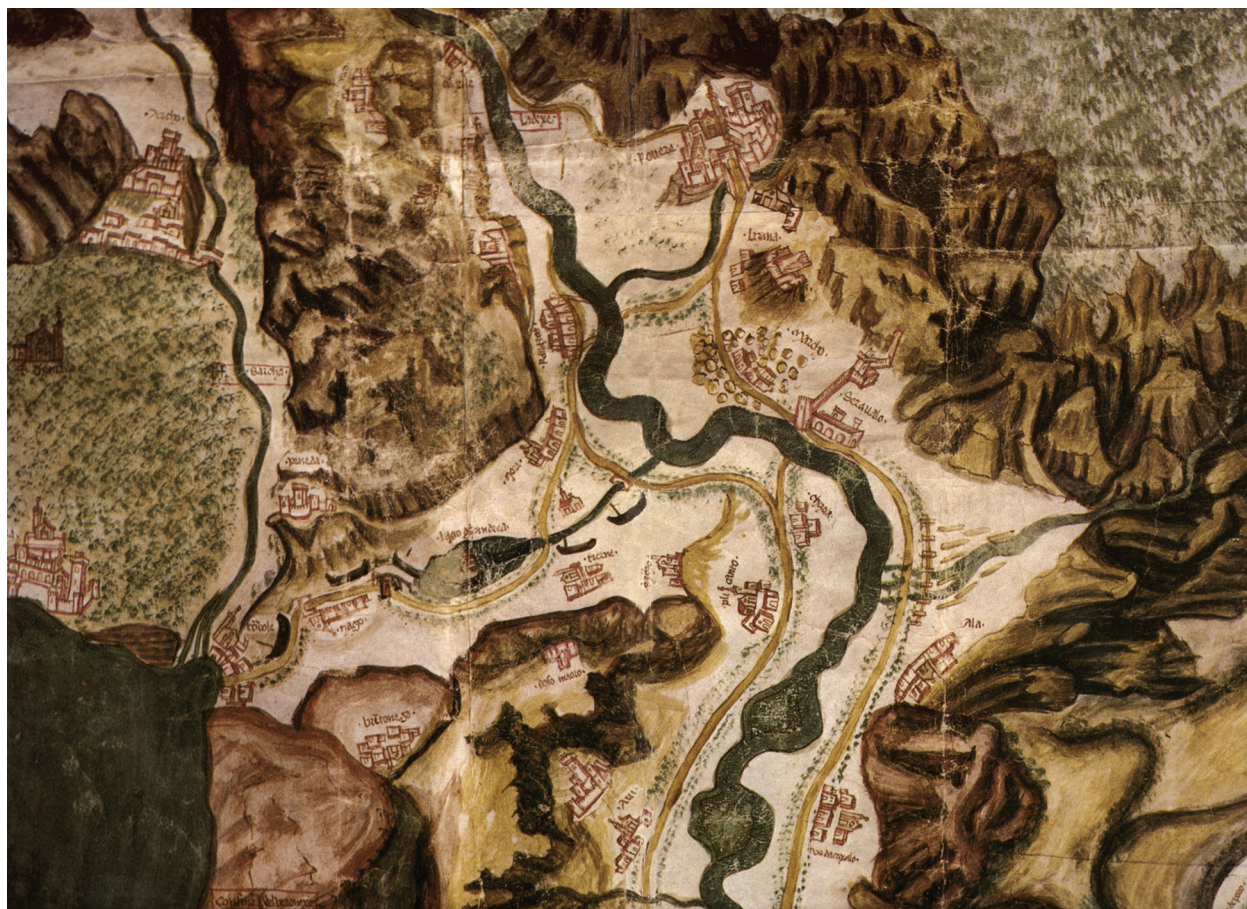
Figura 1.6. Particolare della Carta dell'Almagià con il Lago di Loppio e l'isola di Sant'Andrea. Venezia, Archivio di Stato, Miscellanea mappe , dis. 1438 (da Lodi, Varanini 2014).

et postovi custodia, per esser il passo di andar a Riva 27 . Il riferimento è probabilmente a quegli 83 uomini di cui riferisce la copia ottocentesca eseguita dal trentino Giovanni Battista Sardagna di un documento – peraltro non datato ma a quanto sembra conservato a Venezia 28 – a tenore del quale tanti erano gli armati che Brunoro da Bruna avrebbe condotto “ al lageto de S. Andrea ” per presidiarlo 29 . Fino ad oggi, tuttavia, gli scavi archeologici non hanno riportato alla luce alcuna testimonianza di questo apprestamento militare, probabilmente provvisorio e deperibile, circa il quale vale la pena di aprire ora una breve parentesi.