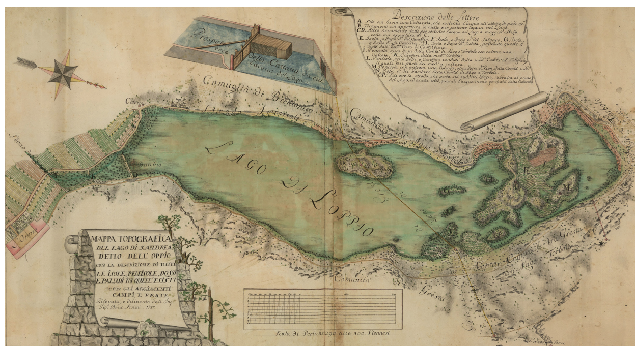
Figura 1.11. Mappa Topografica del lago di S. Andrea detto dell'Opplano con la descrizione di tutte le isole, penisole, dossi e paludi in quell'esistenti con gli aggiacenti campi, e frate. Rilevata, e delineata dall'Ing. Gio. B.mio Scotini, 1787, Tirolerlandesmuseum Ferdinandeum, Innsbruck (da Mattei 2014).

bonarie e indulgenti) 60 cionondimeno appare in qualche modo interessante: innanzitutto descrivendo quello di Sant'Andrea 61 come “un isolotto coperto di rovi e di pochi ammassi di rottami” essa sembra alludere a ruderi che potrebbero essere anzitutto quelli della chiesa, peraltro non segnalata nel testo (ciò che, oltre a stabilire un pur tardo terminus ante quem , non contrasta con l'ipotesi che il suo abbandono potesse risalire ad almeno un centinaio d'anni prima). In secondo luogo lo scritto, attraverso l'inedita e curiosa narrazione leggendaria che riferisce, tramanda probabilmente il modo in cui la fantasia popolare cercava di rendere ragione di strutture di cui sopravviveva ormai solo una vaga memoria – materiale e toponomastica – ma a proposito delle quali, cancellato ogni autentico ricordo storico, non si conosceva più alcuna notizia o