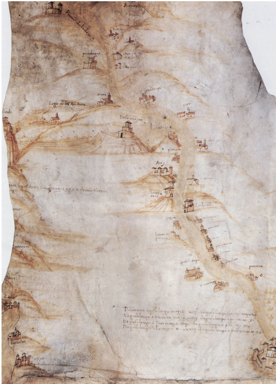
Figura 1.7. Carta di S. Maria della Carità, 1480 ca., Venezia, Archivio di Stato, Scuola della Carità, busta 36, n. 2530 (da Etsch/Adige 2005).

terrapieno” ubicate in qualche “luogo strategicamente importante” e “costruite in tempi molto brevi, per rispondere a specifiche esigenze strategiche” che in area veronese erano sorte numerose già alla fine del Trecento 33 . Una bastia di questo genere (indicata per antonomasia come la bastia ) viene descritta effettivamente anche nella Carta dell’Almagià nei pressi di Montecchia di Crosara, dov’è rappresentata come nient’altro che un robusto steccato 34 (Figura 1.8).