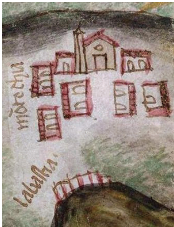
Figura 1.8. Particolare della Carta dell'Almagià con la Bastia di Montecchia. Venezia, Archivio di Stato, Miscellanea mappe , dis. 1438 (da Lodi, Varanini 2014).

dell'isola di Sant'Andrea e giudicare il tipo di edificio ivi realizzato all'inizio del Cinquecento. La soluzione può forse essere suggerita a questo punto da altre annotazioni dello stesso Sanudo, il quale segnala come in quel periodo a Milano 37 “voleno far li bastioni di le porte, di muro; hano posto a l'incanto, non trovano chi li voja far” (anche se successivamente ne saranno realizzati ben nove “di piera” al costo di ben mille ducati l'uno) 38 : dunque la costruzione di “bastioni” in muratura rappresentava un'eccezione, essendo rilevata espressamente e non data per scontata; ed era anche un problema, giacché per essere realizzata richiedeva un maggiore sforzo costruttivo, economico e organizzativo, nonché anche una competenza tecnica superiore, di quanto altrimenti sarebbe normalmente bastato. In definitiva quindi si può concludere che nel linguaggio di Sanuto il “bastione” sia essenzialmente da intendersi come una struttura provvisoria in legno e terra, talvolta eventualmente murata, sempre comunque utilizzata con scopi di vedetta, di presidio e di difesa di punti strategici.