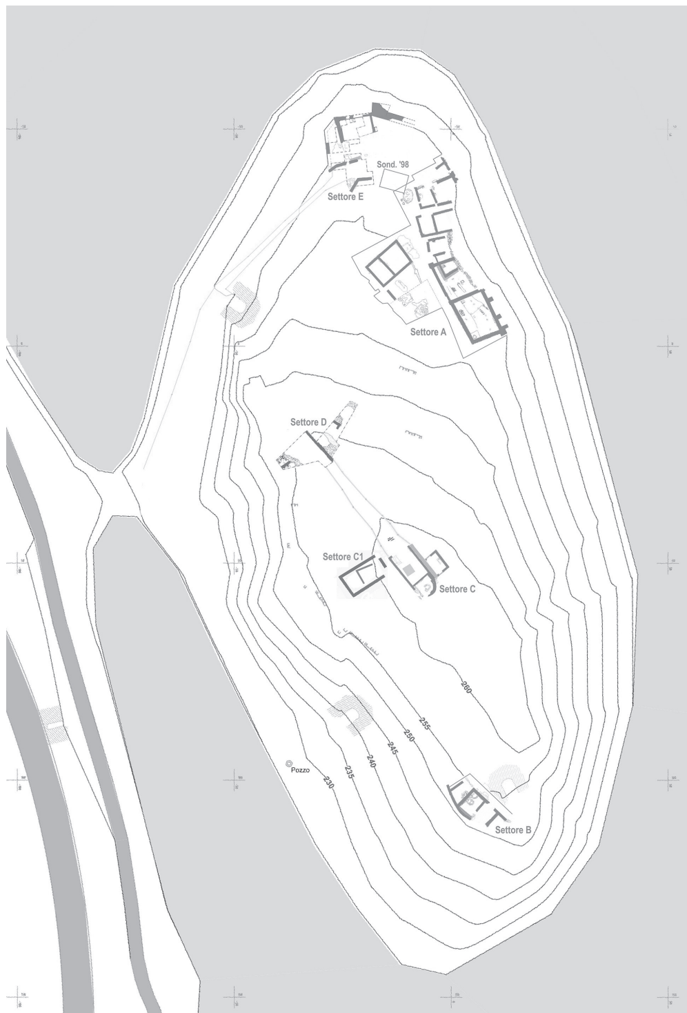
Figura 1.12. Rilievo planoaltimetrico dell'Isola di S. Andrea, con indicazione delle aree scavate dal 1998 al 2017 (rilievo geom. L. Prezzi, C. Bona).

scavi nei Settori A, B, D ed E, corrispondenti ai presunti resti di un castrum di età tardoantica/altomedievale, è stata dedicata una monografia nel 2016, mentre il presente volume raccoglie i risultati delle ricerche effettuate nelle restanti aree di scavo, ovverosia i Settori C e C1, comprendenti i ruderi di edifici più recenti e non compresi nella precedente trattazione.