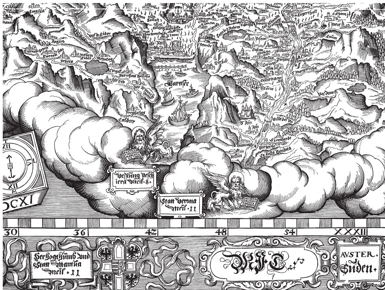
Figura 1.9. Particolare della Tirolische Landtafel di Mathias Burgklechner (da Mostra Cartografia 1985).

l'opera di Joseph von Spersg intitolata Tyrols pars meridionalis Episcopatum Tridentinum... , del 1762 e l' Atlas Tyrolensis di Peter Anich, del 1774. Della chiesa non si trova del resto traccia nemmeno in alcune piante a piccola scala quali la Mappa Topografica del lago di S. Andrea detto dell'Oppio, con la descrizione di tutte le isole, penisole, dossi e paludi in quell'esist[ent]i con gli aggiacenti campi, e frate rilevata, e delineata dall'ing. Gio[vanni] B[artolo]mio Scotini del 1787 55 (Figura 1.11) e la Mappa Topografica del Monte Bordina di ragione della Comune di Brentonico ... dell'agronomo Giovanni Battista Sartori del 1814 56 , che documentano e precisano il passaggio di linee confinarie sulla sommità dell'isola 57 . Dal Settecento in poi, inoltre, l'espressione "Lago di Loppio" diviene prevalente nella cartografia, nonostante il nome della chiesa di Sant'Andrea ricorra fino addirittura ai primi