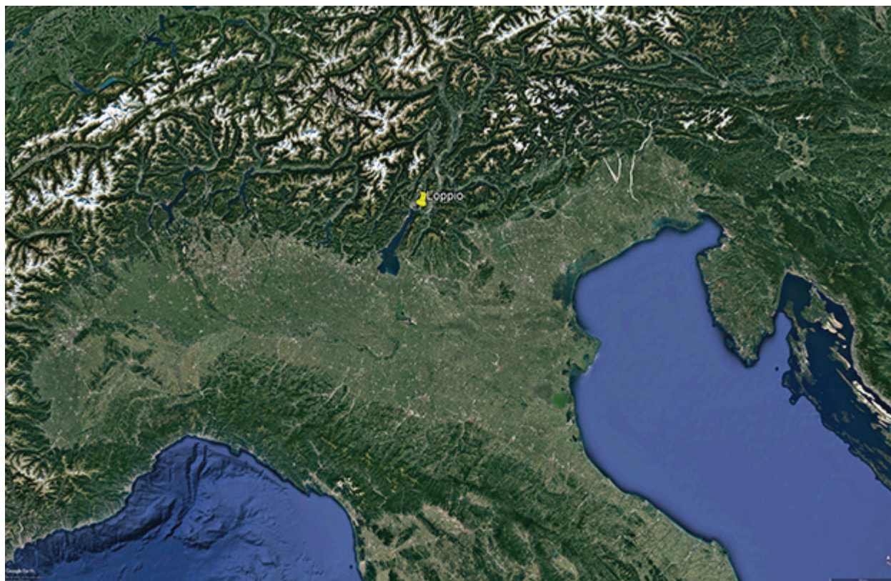
Figura 1.1. Immagine del Norditalia, con localizzazione del sito di Loppio.