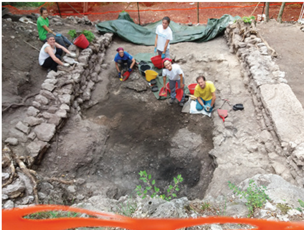
Figura 1.14. Panoramica del Settore C1 in corso di scavo, da est (2017).

messe completamente in luce la base, lacunosa, del perimetro murario e la potente struttura a scarpa che si appoggiava al muro nordorientale. Contestualmente allo scavo all'interno della chiesa, nel 2003 si è proceduto anche a indagare l'area esterna a sudest dell'edificio sacro su una superficie di circa 160 metri quadrati. Lo scavo ha rivelato la presenza della roccia basale, qua e là regolarizzata con gettate di calce, poco al di sotto del piano di calpestio attuale. La balza rocciosa che delimitava il terrazzo lungo la fascia sud-sudovest appariva in parte integrata artificialmente tramite un allineamento di grosse pietre, mentre all'estremità opposta il pianoro risultava delimitato da un muro di contenimento.