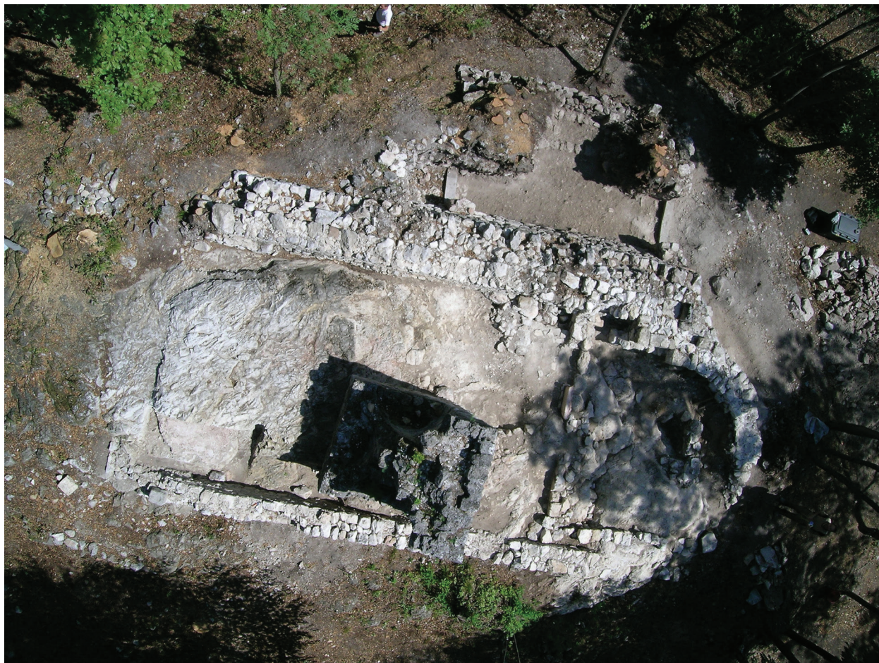
Figura 1.13. Foto da pallone del Settore C.

stata affidata la supervisione sul campo. Già prima dell'apertura del saggio di scavo, in tale area erano chiaramente visibili i resti murari della chiesa di Sant'Andrea, sulle cui macerie si impostava un'edicola quadrifronte 88 . Fin dall'inizio delle indagini è risultato evidente come la parziale esposizione delle strutture e lo spessore relativamente ridotto del deposito stratigrafico dovessero avere richiamato l'attenzione e favorito l'attività degli scavatori abusivi: il deposito stratigrafico, già disturbato da interventi di spoliazione susseguitesis ripetutamente nel corso del tempo, recava infatti evidenti tracce di scavo recente. Ulteriori "visite" di tombaroli si dovettero d'altra parte registrare purtroppo anche dopo l'avvio delle ricerche nell'area da parte del Museo Civico di Rovereto.