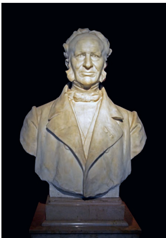
Figure 1. Buste de Fr. Cailliaud au Muséum d'Histoire Naturelle de Nantes.

L'explorateur nantais Frédéric Cailliaud (Nantes, 1787 – Nantes, 1869), bien que passionné par les sciences naturelles depuis l'enfance, en particulier la géologie et les minéraux, choisit de se former comme bijoutier à l'âge adulte. Ce métier lui permit de voyager un peu partout en Europe. Lorsque l'empire de Napoléon s'effondra, il se retrouva dans le Royaume de Naples, qu'il décida ensuite de quitter pour éviter des conséquences politiques possibles. Il partit rejoindre la cour du Sultan ottoman Mahmoud II au Topkapi, où il devint le spécialiste des pierres précieuses du palais. Depuis Istanbul, inspiré par les dessins des savants de la Description de l'Égypte et par les esquisses de Vivant Denon réalisés tout au long de ses voyages dans la vallée du Nil et dans les déserts, il s'embarqua sur un vaisseau qui l'eut conduit dans le delta du Nil. À Alexandrie, il rencontra Bernardino Drovetti, le vice-consul de France, qui, profitant de ses compétences en sciences naturelles, lui proposa de participer à une expédition le long du Nil entre 1815 et 1818, jusqu'à Ouadi Halfa, en amont de la deuxième cataracte du Nil. Il devint rapidement le minéralogiste officiel du vice-roi Méhémet-Ali qui lui confia, entre 1816-1819, trois expéditions à la recherche des anciennes mines d'émeraudes de Ptolémée VI Philométor, au Djebel Zubarah, entre le Nil et la Mer Rouge. Il les trouva finalement, mais elles n'étaient plus exploitables. En tant que premier occidental, il visita